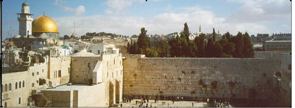
Tempelberg in Jerusalem